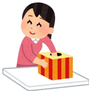
【応募総数は121枚でした】

なお、ひなっぴータオルの当選者(30名)は、お届けをもって発表に代えさせていただきます。