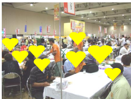
【2日間ともたくさんのお客様にご来場いただきました】

8月26日・27日、毎年恒例の「ハローガス大感謝祭」がアクセスサッポロにて開催されました。今年イベントが大きく様変わりし、特にキャラクターショーは大人気で、お子様連れのご来場も多く、会場は笑顔や歓声で溢れました。