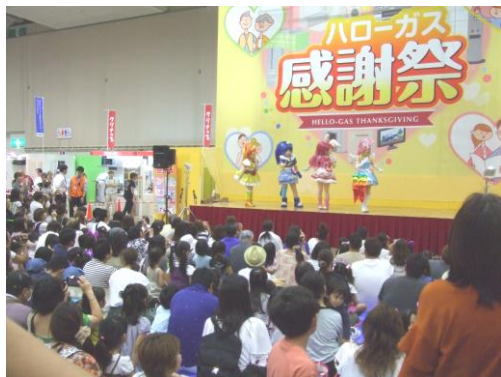
【キャラクターショーは大賑わい】