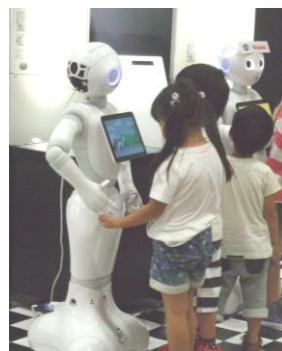
【ペッパーくんも登場】

ネンセツ独自企画『わたあめ』『ぬりえ』も大好評。『ぬりえ』は弊社ショールームにて9月いっぱい展示中。また、ホームページを使った『ネンセツクイズ』の当選者はご覧の通りです。たくさんご応募いただき、ありがとうございました！