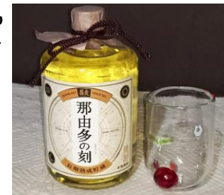
【写真右はお気に入りのグラス】

口当たりと喉ごしが良く、とても飲みやすいお酒です。ちょっとだけ高価な焼酎なので、量を過ぎると妻に怒られますが、それでもついつい飲んでしまいます(汗)。