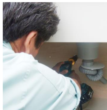
【流し台入れ替え作業の様子です】

キッチン・洗面所・トイレの入れ替えなどのリフォームもご相談を！ フリーダイヤル 0120-23-0422