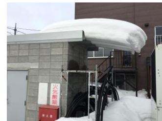
【芸術的な雪庇でした…】

写真は、2月中頃の弊社ガスボンベ庫の様子です。落雪寸前に、お隣様からご連絡を頂戴し慌てて雪降ろし…(汗)。まるでリーゼントヘアのような光景に思わず写真をパチリ！